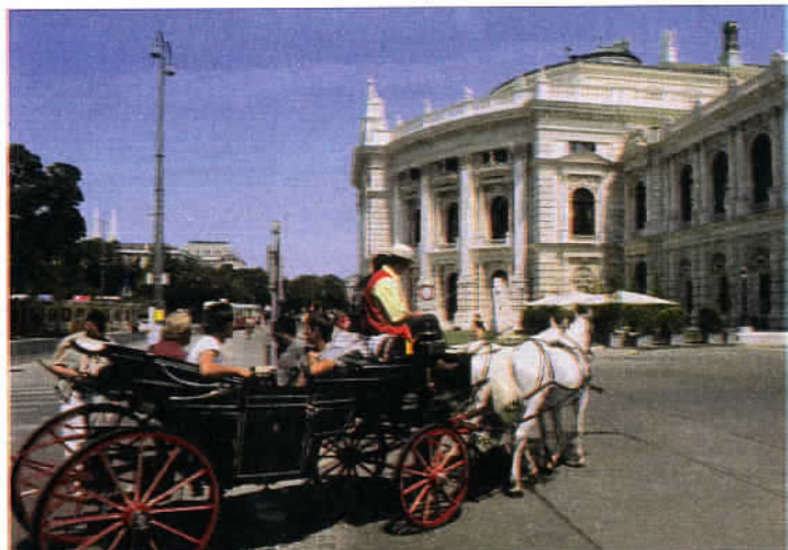
Le quartier de Hofburg, au cœur de Vienne.

Un peu à l'extérieur de la ville de Vienne se trouve le château de Schön-